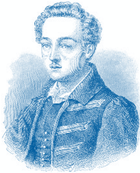
Georg Büchner 1813–1837