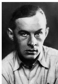
Erich Maria Remarque (1898–1970)