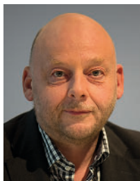
Thomas Hettiche (geb. 1964)