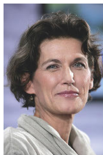
Janne Teller (*1964)