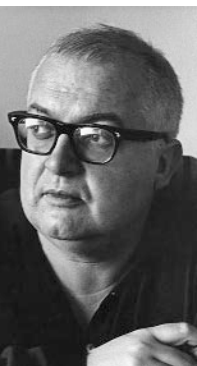
Friedrich Dürrenmatt (1921–1990)