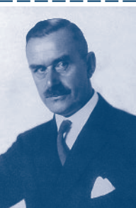
Thomas Mann (1875–1955) im Jahr 1928