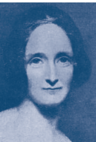
Mary Wollstonecraft Shelley (1797–1851)