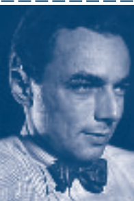
Erich Kästner (1899–1974)