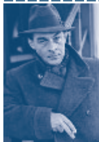
Erich Maria Remarque 1898 bis 1970