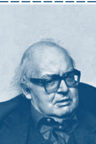
Friedrich Dürrenmatt (1921–1990)